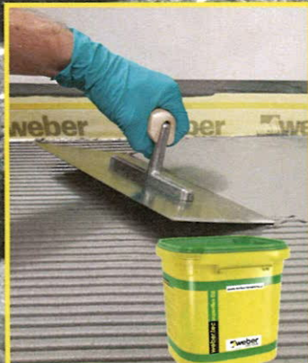
weber.tec superflex D2